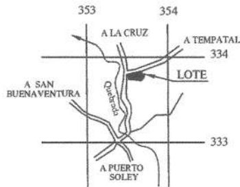
UBICACION HOJA - BAHIA DE SALINAS ESCALA 1:50000